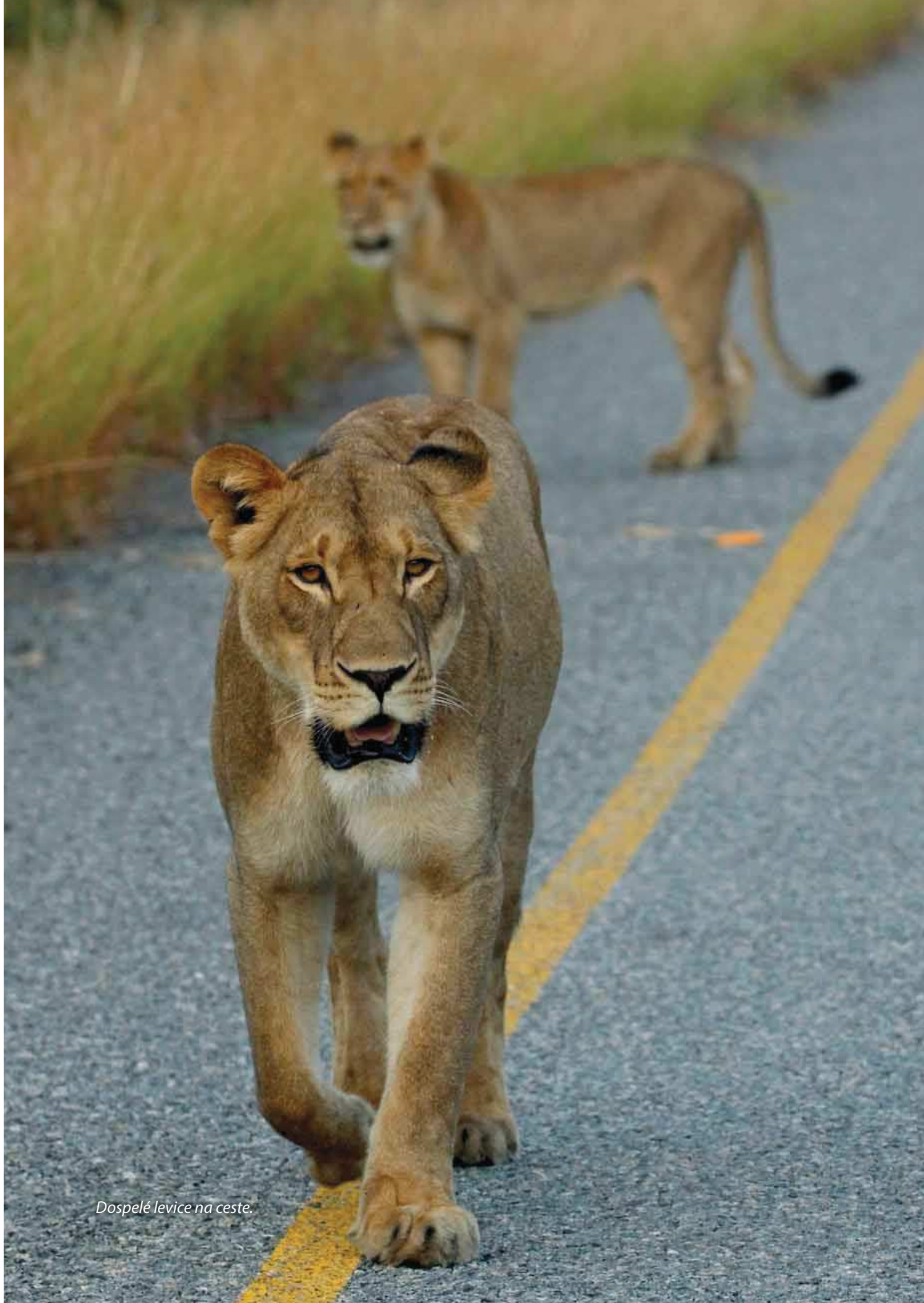
Dospělé levice na ceste.