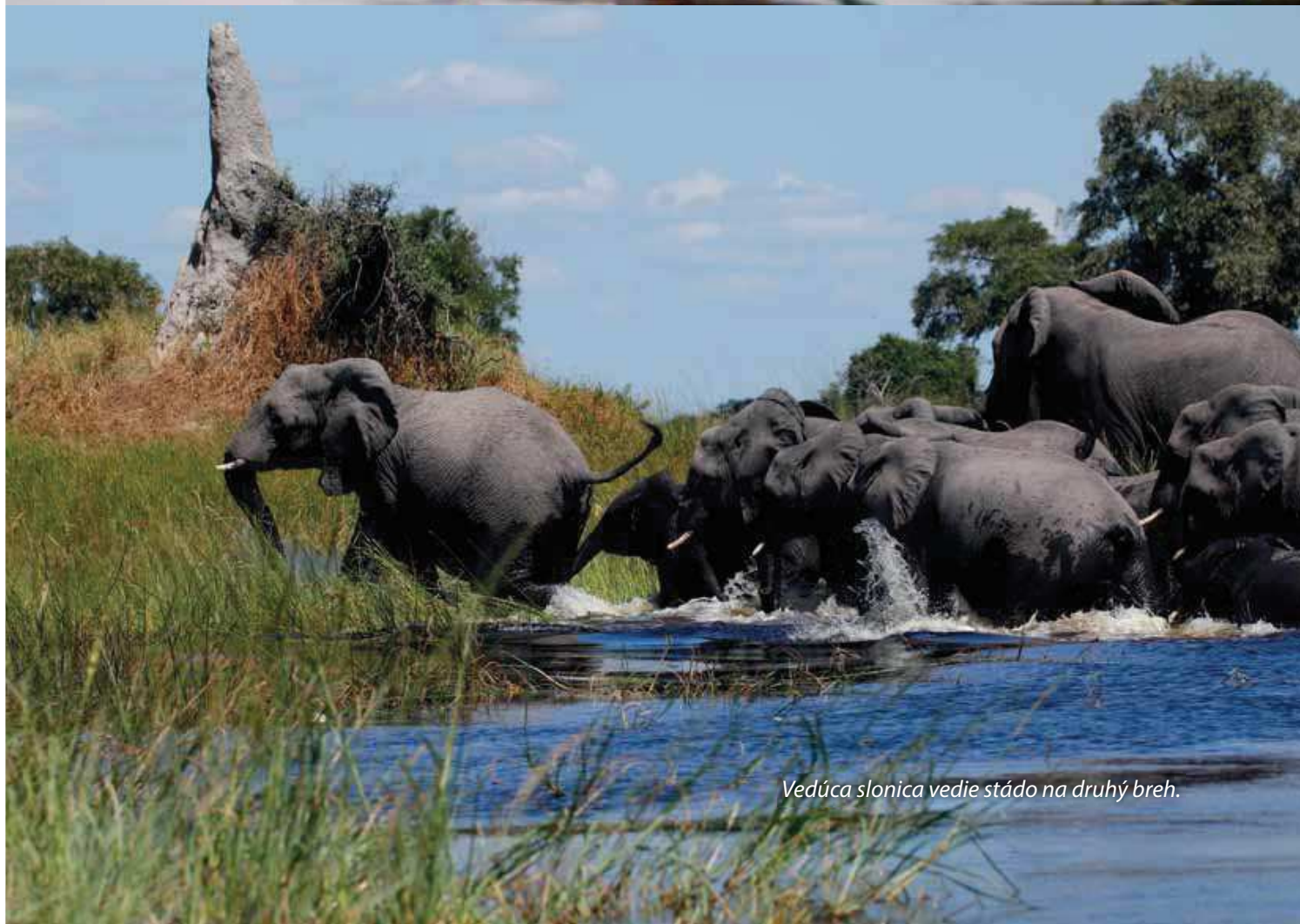
Vedúca slonica vedie stádo na druhý breh.