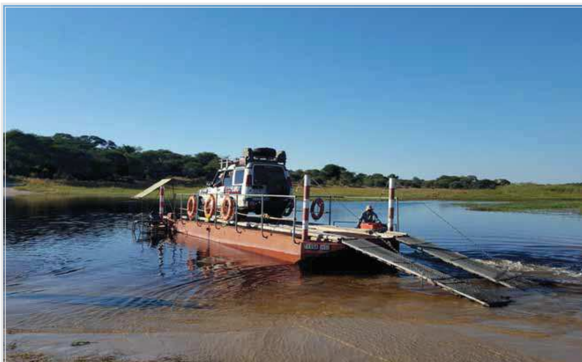
Kompa cez rieku v mestečku Kumaga.