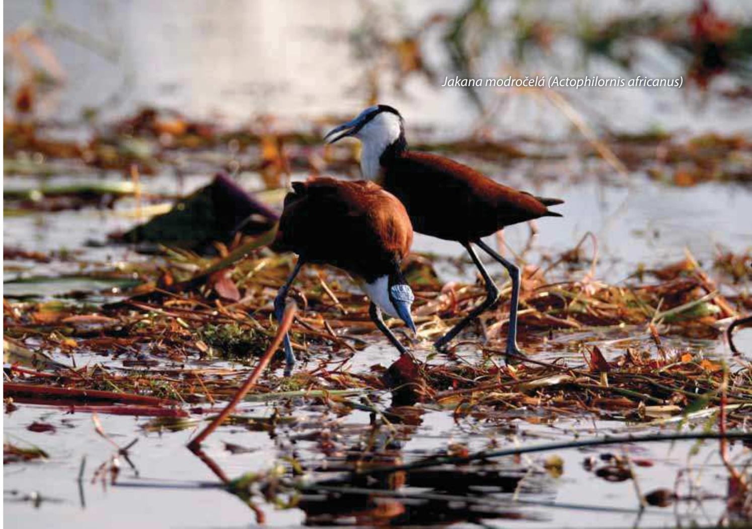
Jakana modročelá (Actophilornis africanus)