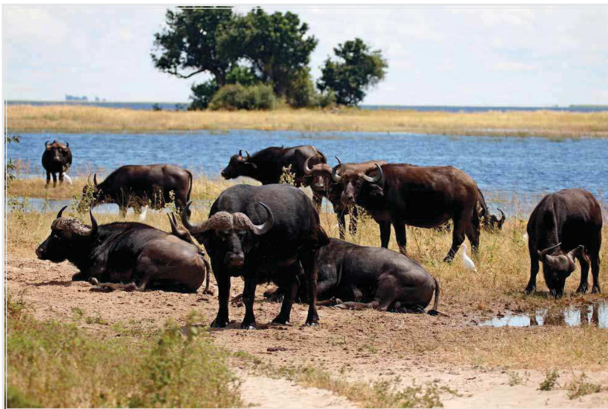
V obklúčení stádom byvolov.

Návrat do kempu nás nepotešil. V rannom zhone sme pred odchodom zabudli zatvoriť stany. Výdatný lejak nám zalial stany a veci v nich nám namokli. Dvíhame, prevraciame stany a vylievame z nich vodu.