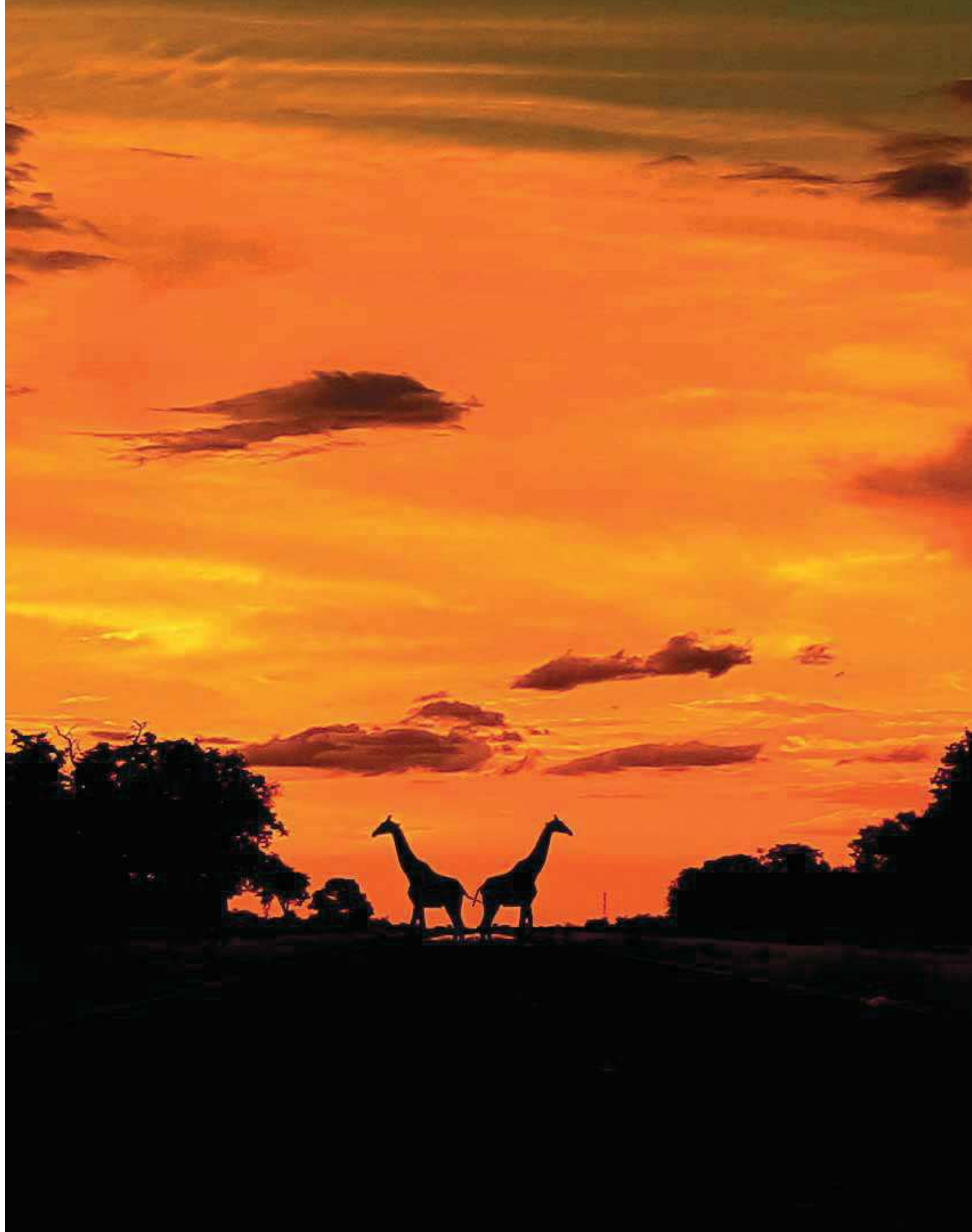
Siluety žiráf, čnejúce nad krajinou, po západe slnka.