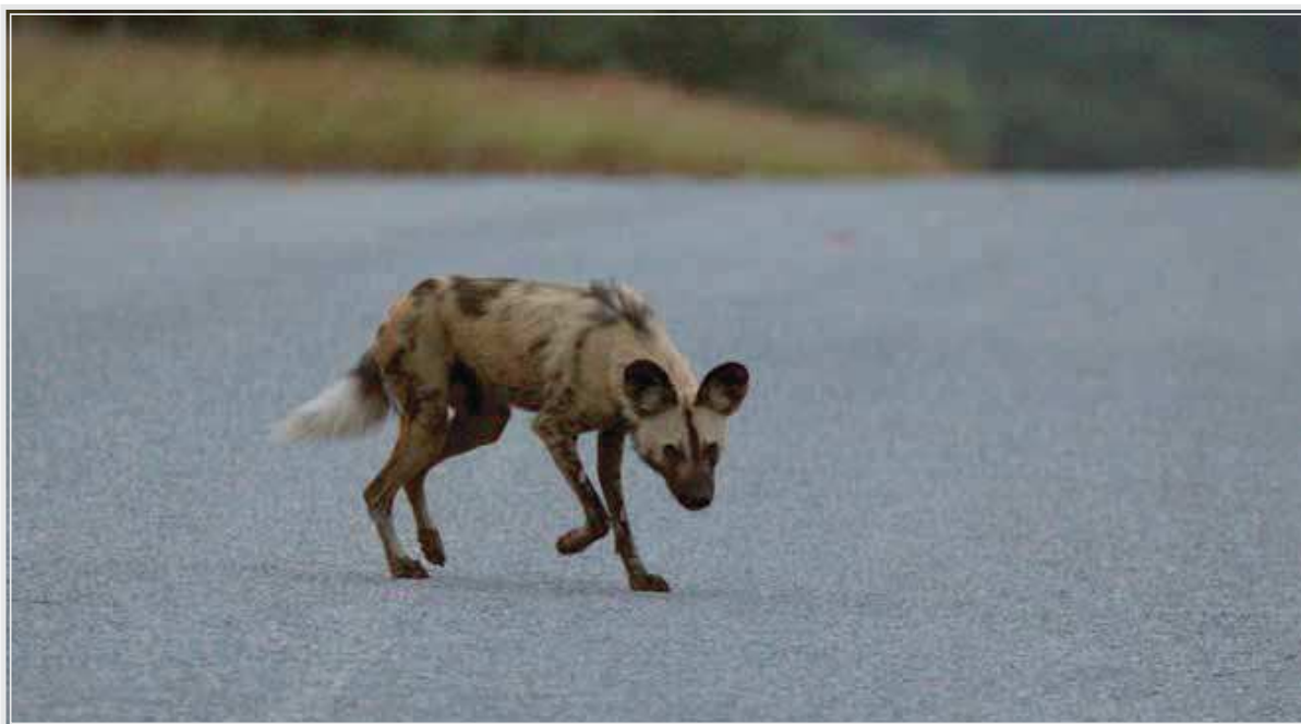
Zakrádajúci sa pes hyenovitý.